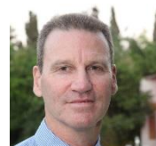
ד"ר רונן ראל (יולי 2023 ואילך)

פרופסור אמריטוס לכלכלה באוניברסיטה העברית.