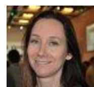
ד"ר גלי עינב

בעברו המפקח על הביטוח ונציב שוק ההון. כיום מכהן כיו"ר דיווד שילד חברה לביטוח ויו"ר קבוצת דיווד שילד המתמחה בתחום הבריאות בארץ ובעולם. כמו כן יזם בתחום האנרגיה המתחדשת.